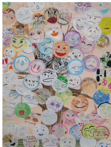
児童養護施設でのワークショップで子どもたち と職員の方々が描いた気持ちの顔の絵

これまでに「子ども虐待」「DV」などをテーマとした講演を数多く行っています。 また、自分の気持ちに気づき、気持ちを表現して分かち合う「エモショナルリテラシー」をテ ーマにしたオリジナルの「気持ちのキセキ ワークショップ」を児童養護施設や東日本大震災の被災 地の小・中学校などで行ってきました。ワークショップは50回以上行っています。子ども向け と、子どもの支援者などの大人向けのプログラムがあります。子どもの支援者の方々や、学校、 子育て中のお母さんたちのグループなどからのご依頼お待ちしております。